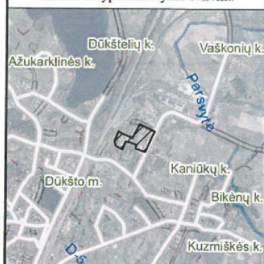
Žemės sklypo išdėstymo schema